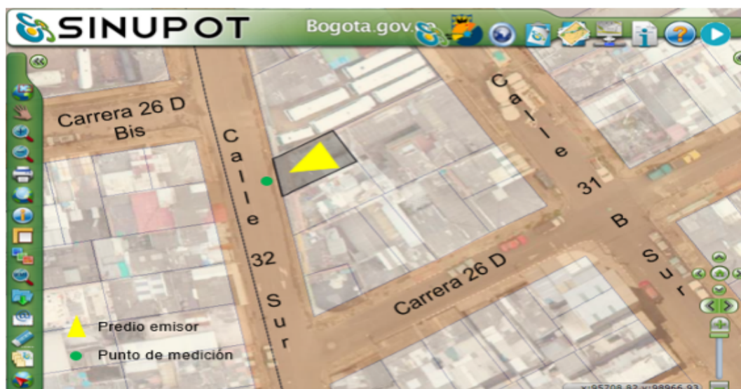
Figura 1. Ubicación del predio emisor y punto de medición.

Nota 5: Datos suministrados en el Anexo No 6. Reporte SINUPOT